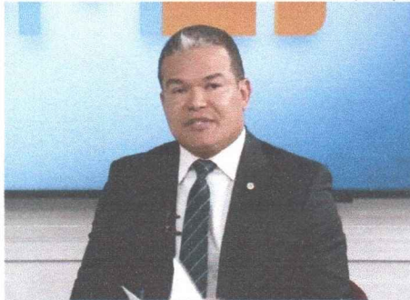
Coronel Sílvio Leite, titular da Secretaria de Estado da Segurança Pública do Maranhão

Os esforços do governo do Estado, a partir de ações da Secretaria de Estado de Segurança Pública (SSP-MA), levaram à redução das ocorrências de mortes violentas em todo o território maranhense. O Maranhão é o primeiro estado do Nordeste e o 14º do Brasil na redução destas criminalidades e se destaca ainda com a segunda menor taxa de homicídios do país. Entre as capitais brasileiras, São Luís é a que possui o menor número de registros. Os dados, referentes ao ano de 2021, são do Anuário Brasileiro do Fórum de Segurança Pública, divulgado no final de junho. Dados da SSP-MA apontam a redução em 14% nos roubos a veículos e assaltos a ônibus; de 47% nos homicídios; e 50% nas mortes violentas (lesão corporal, morte, roubo seguido de homicídio e homicídios). Isso é fruto dos constantes investimentos que tivemos em segurança pública e que vêm ocorrendo desde 2015. Inclui o aparelhamento do sistema, investimentos em pessoal com a capacitação e ações de valorização, aquisição de viaturas, munições e equipamentos, além de investimentos na